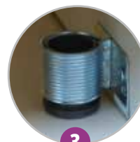
3 Pieds vérins pour mise à niveau