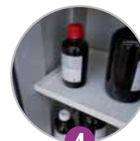
4 Étagères de rétention