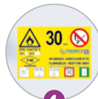
1 Pictogramme normalisé