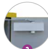
2 Ferme-porte avec thermofusible