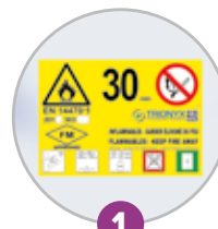
1 Pictogramme normalisé