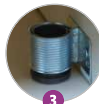
3 Pieds vérins pour mise à niveau