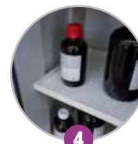
4 Étagères de rétention