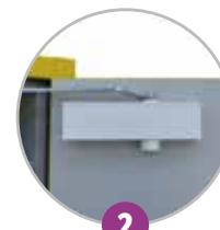
2 Ferme-porte avec thermofusible