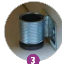
3 Pieds vérins pour mise à niveau