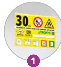
1 Pictogramme normalisé