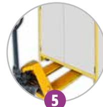
5 Déplacement par transpalette (à vide)