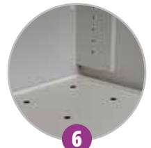
6 Bac de rétention amovible + caillebotis en option