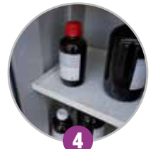
4 Étagères de rétention