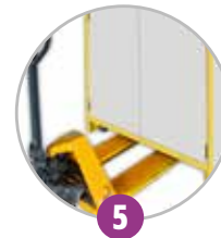
5 Déplacement par transpalette (à vide)