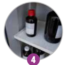
4 Étagères de rétention