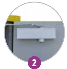
2 Ferme-porte avec thermofusible