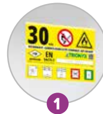
1 Pictogramme normalisé