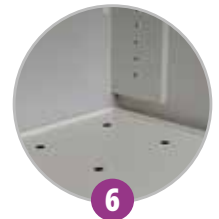
6 Bac de rétention amovible + caillebotis en option