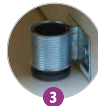
3 Pieds vérins pour mise à niveau