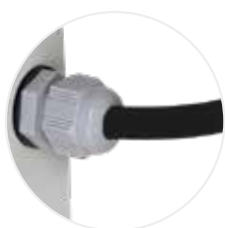
Passage des câbles PEXTBALI14 (option incluse avec PRISELI14)