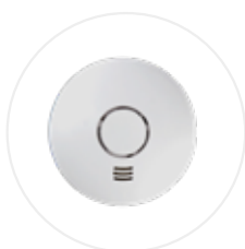
Détecteur de fumée connecté ALARMWI (option)