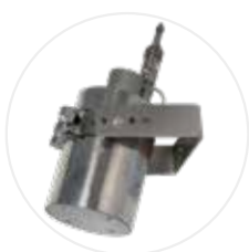
Extincteur EX100LI/EX200LI (option)