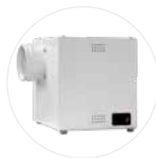
Caisson de ventilation CDV-A (option)