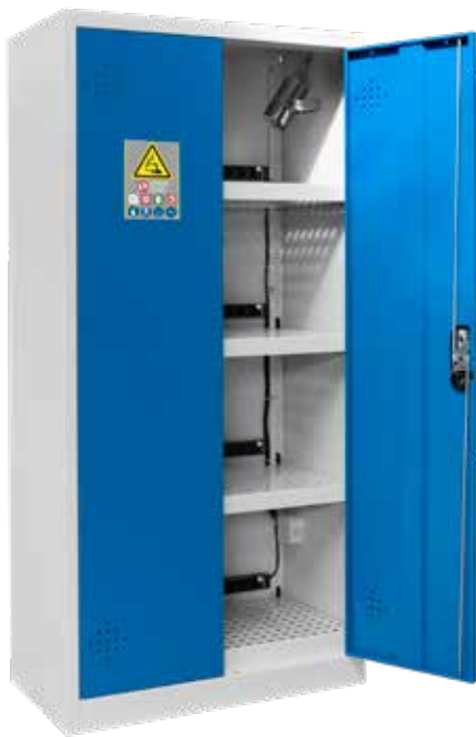
▲ AZ301BLI + 4 PRISELI14 + EX200LI + PEXTBALI14